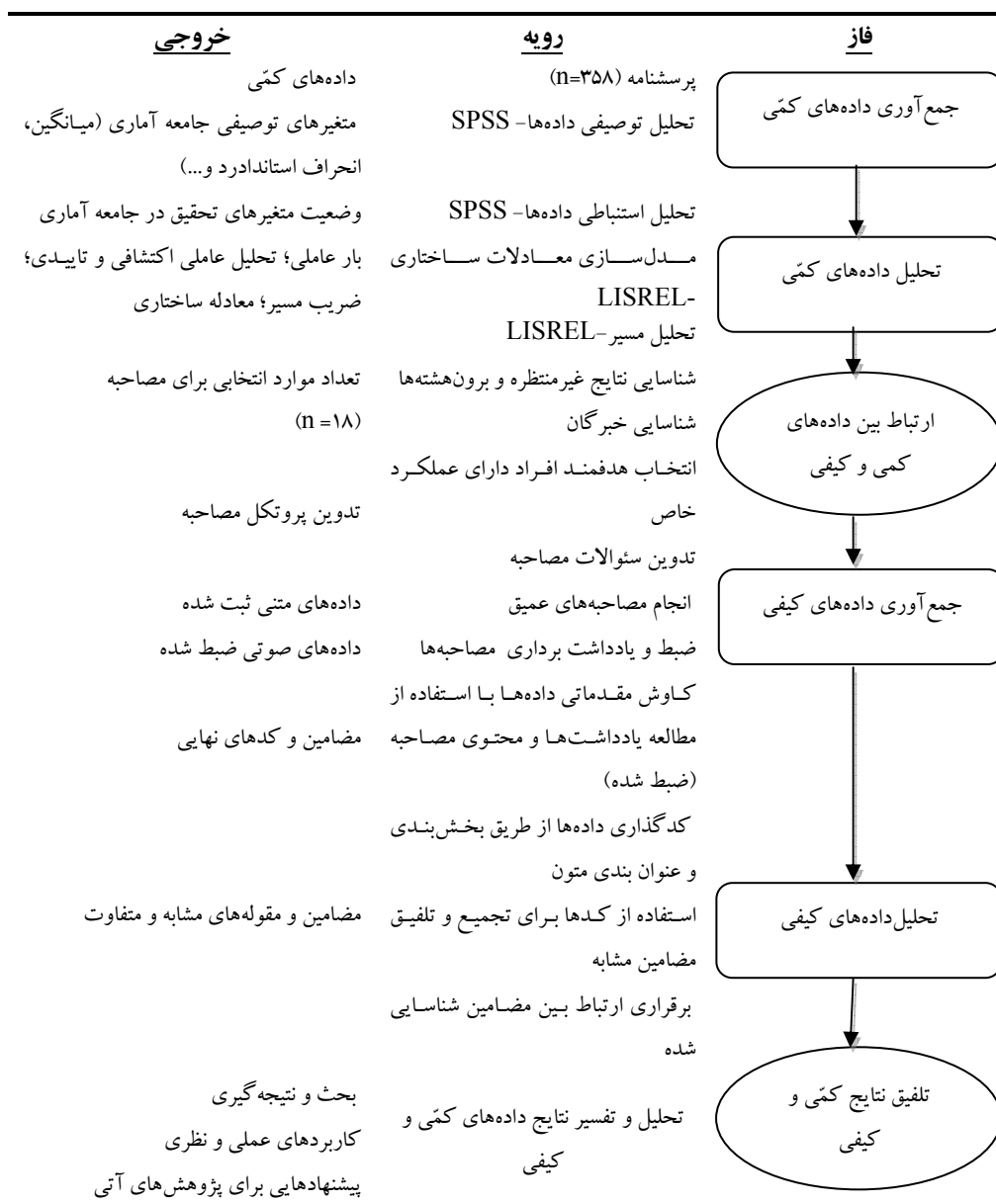
شکل ۳: الگوی تصویری روش‌شناسی پژوهش ترکیبی ترتیبی - تبیینی