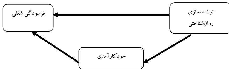
شکل ۱: مدل مفهومی تحقیق