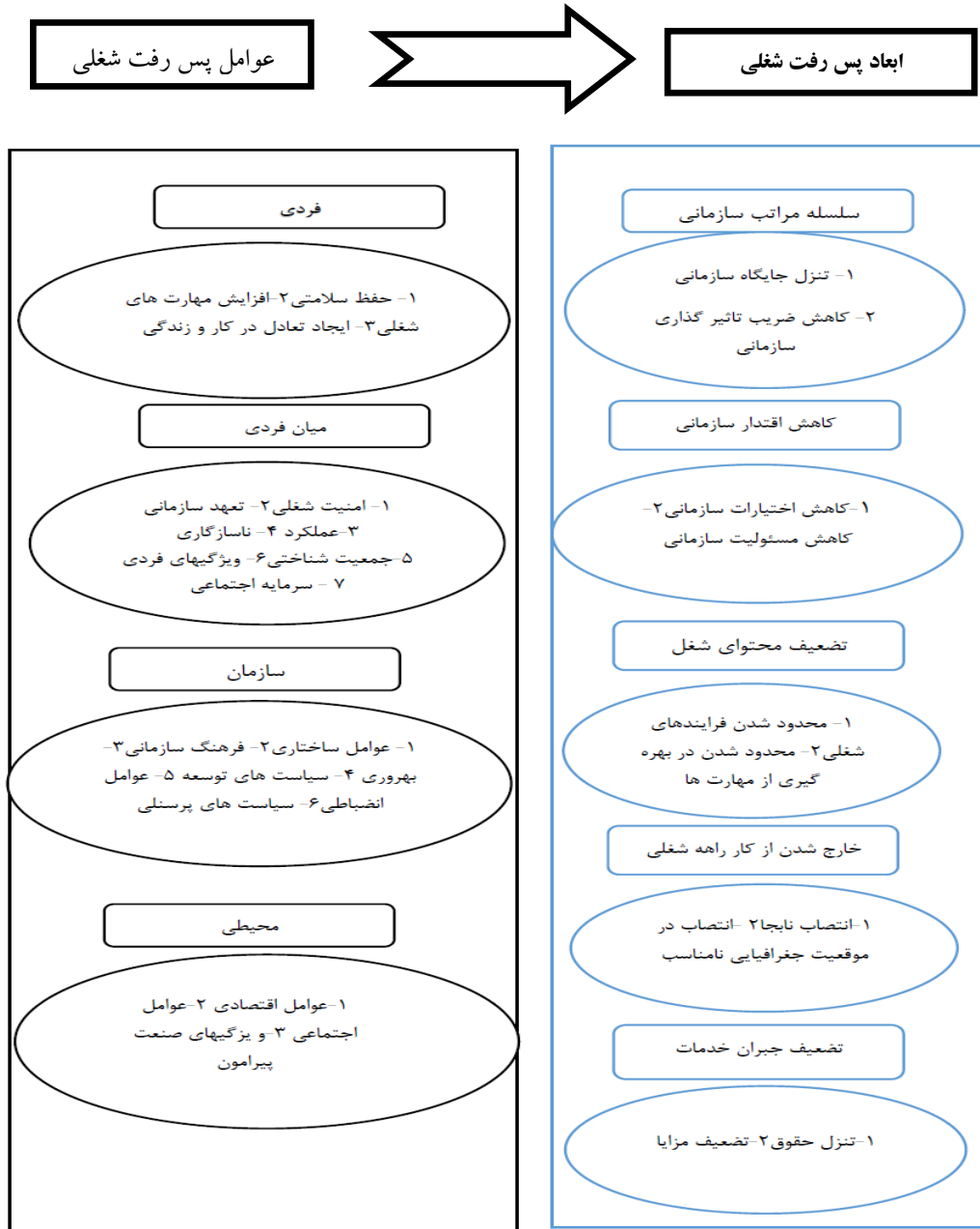
شکل ۳: مدل مفهومی پژوهش

پس از بررسی و جمع بندی یافته های پژوهش، مدل مفهومی زیر به دست آمده است: